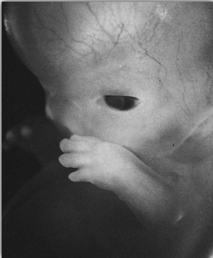
Osmý týden života